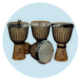
Djembés, Afrika- nische Trommel