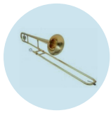
Posaune Euphonium Es-Horn, Tuba